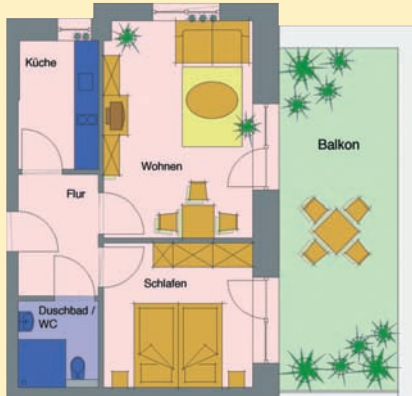
Beispiel für ein Zweizimmer-Appartement