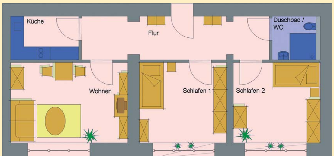
Beispiel für ein Dreizimmer- Apartment