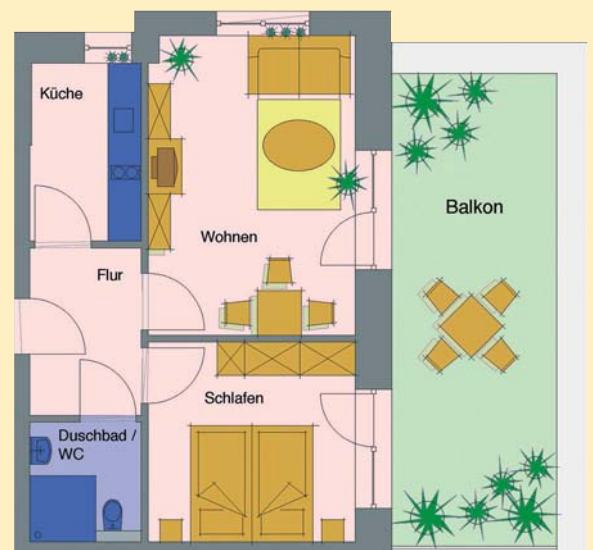
Beispiel für ein Zweizimmer-Apartment